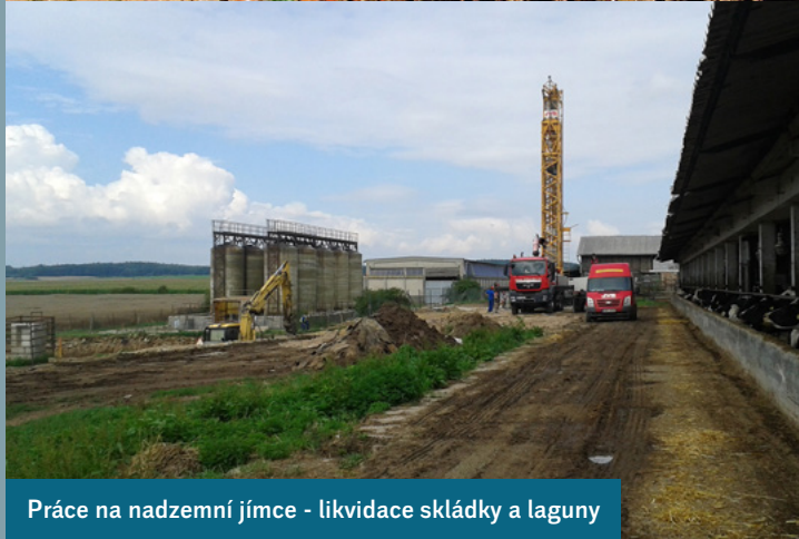
Práce na nadzemní jímce - likvidace skládky a laguny