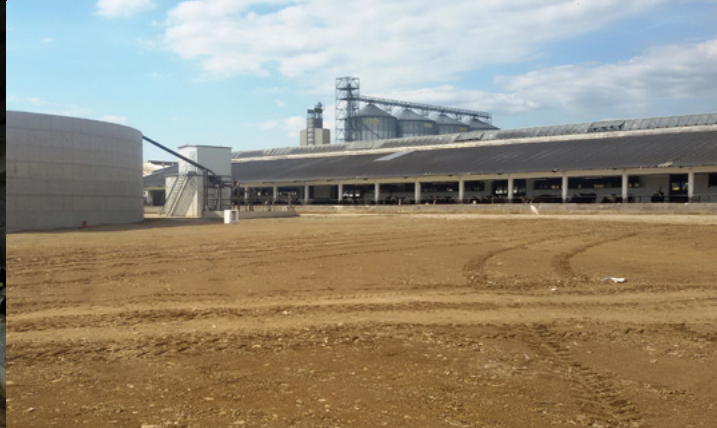
Současný stav – nová nadzemní jímka s rekultivovaným pozemkem