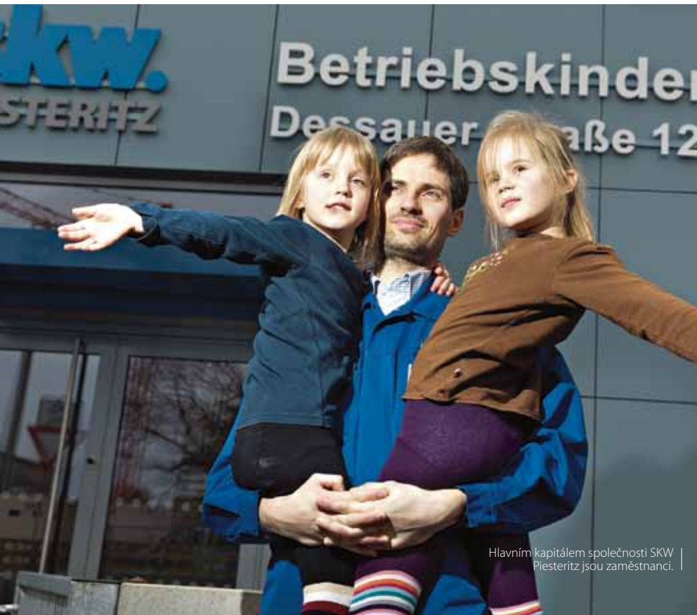
Hlavním kapitálem společnosti SKW Piesteritz jsou zaměstnanci.