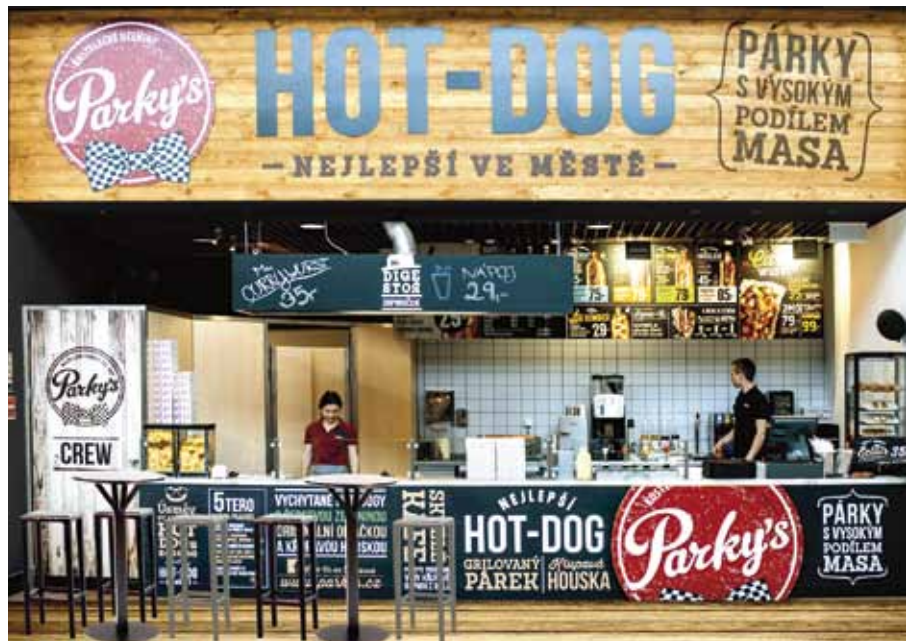
V Obchodním centru Černý Most naleznete stánek Parky's v tzv. food-courtu, tedy v zóně, kam jdou lidé cíleně za občerstvením

Obchodní centra jsou obecně rozdělena do několika výkonnostních skupin. Aktuálně uzavíráme smlouvy v těch nejlepších v České republice. Jejich podmínky jsou velmi tvrdé a většinou je mohou splnit jen společnosti s dostatečným finančním zázemím. Mezi základní požadavky uzavření nájemní smlouvy patří platba kauce v hodnotě několika měsíčních