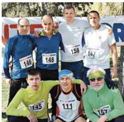
I Zamestnanci Dusla na Nitrianskej bežeckej lige v apríli 2015

Bežci – amatéri z našich radov chcú dať o sebe vedieť a zároveň prezentovať značku zamestnávateľa – Dusla, a to vytvorením amatérskeho bežeckého tímu – Bežecký klub Duslo . Podnetom bola aj skutočnosť, že mnoho spoločností na Slovensku má bežecké tímy svojich zamestnancov, čím sa zaradili do skupiny podnikov podporujúcich aktívny životný štýl pracovníkov, ktorí zároveň propagujú svojho zamestnávateľa.