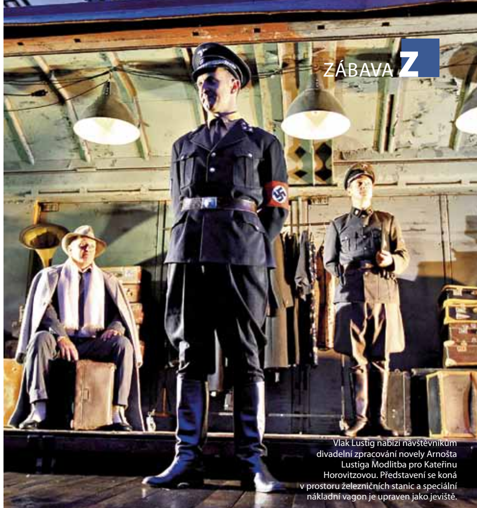
Vlak Lustig nabízí návštěvníkům divadelní zpracování novely Arnošta Lustiga Modlitba pro Kateřinu Horovitzovou. Představení se koná v prostoru železničních stanic a speciální nákladní vagon je upraven jako jeviště.