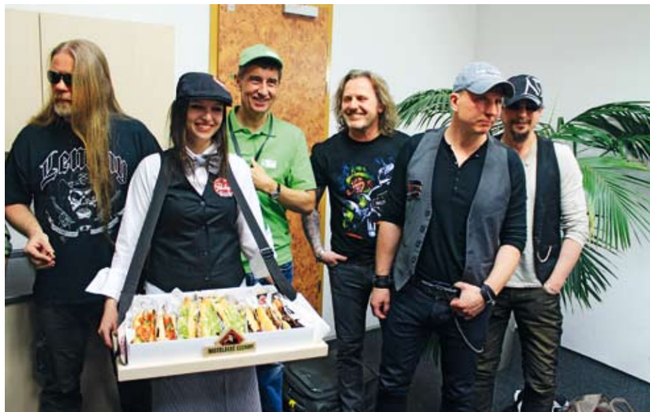
Andrej Babiš zašel s klobáskami i za kapelou Kabát.