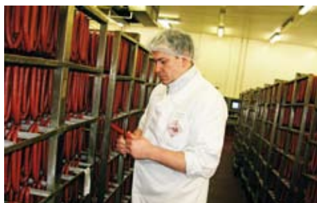
14.00 Před balením musí být zboží dochlazeno na vnitřní teplotu maximálně 5 °C.