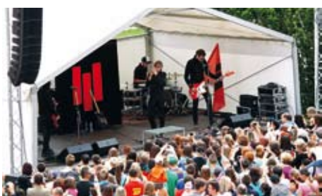
Mezi neočekávanější vystoupení patřil koncert populární skupiny Mandrage.

Skvělá atmosféra a slunečné počasí. Takový byl Den otevřených dveří, který každoročně pro své příznivce pořádá společnost Agrotec v Hustopečích u Brna. Sobota 18. května zpří-