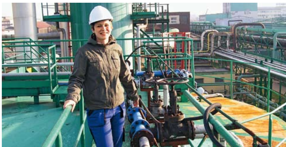
Ve společnosti PRECHEZA, a. s., studenti nejvíce oceňovali příležitost seznámit se s provozem a zajímavými technologiemi. Stáže tu absolvovalo již 19 studentů a dalších 15 se chystá na stáž v létě 2013.

Projekt Partnerství pro chemii je jedinečným projektem v oblasti chemie. V projektu je zapojena Fakulta chemicko-technologická Univerzity Pardubice, DEZA, a. s., FATRA, a. s., Lovochemie, a. s., PRECHEZA, a. s., PREOL, a. s., Synthesia, a. s., a VUOS, a. s. Jen za první rok projektu se ve firmách skupiny Agrofert uskutečnilo více než sto stáží studentů FChT.