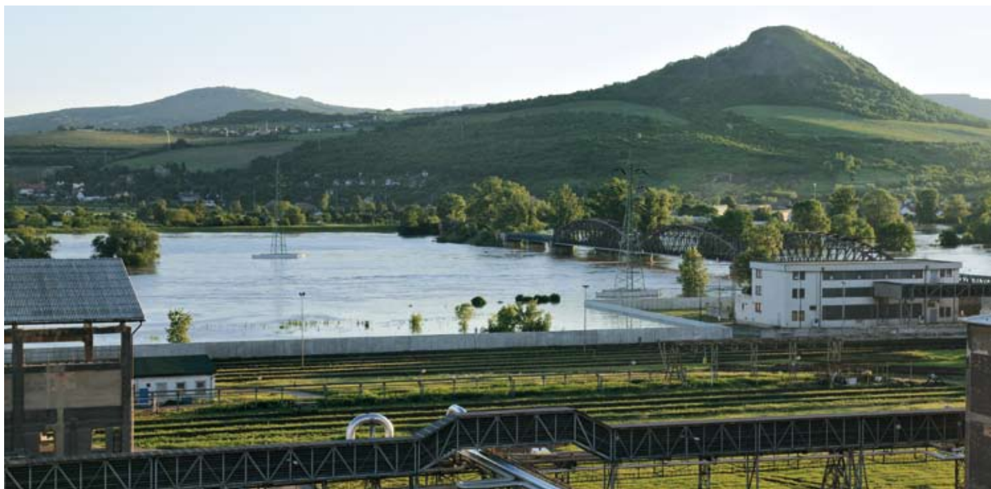
Pohled z ptačí perspektivy na rozvodněné Labe.

Pozitivní zprávou je jistě skutečnost, že ničivé povodně zvedly vlnu solidarity nejen různých humanitárních organizací a společností, ale také mezi zaměstnanci skupiny Agrofert. V době, kdy voda na jednotlivých úsecích řek kulminovala, začaly se množit i dotazy zaměstnanců holdingu, jakým způsobem mohou finančně pomoci lidem, kteří přišli o střechu nad hlavou, případně přispět na odstraňování povodňových škod. AGROFERT HOLDING se proto rozhodl uspořádat zaměstnaneckou sbírku určenou na pomoc lidem zasaženým povodněmi.