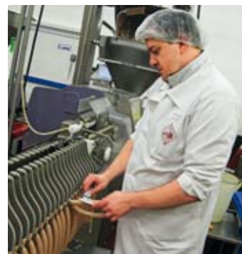
10.00 Při narážení do střívka je důležité, aby uzenina splňovala stanovené parametry: váhu, délku, průměr (kalibr).