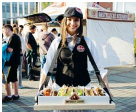
Kostecké uzeniny nově nabízejí pět druhů hotdogů pod značkou Parky's.

Ano, okamžitě jsme zpřísnili už tak poměrně důsledné mechanismy kontroly. Mnohem častěji kontrolujeme maso na přítomnost různých druhů bílkovin, odsouhlasili jsme si se zákazníkem seznam schválených dodavatelů, zahájili jsme intenzivní audity u našich dodavatelů atd. Od samého začátku vše úzce koordinujeme se společností Tesco, kde k nálezům došlo. Společně jsme stanovili mnohá další opatření v samotném výrobním procesu, která do budoucna podobným případům v maximální možné míře zabrání. Byla to nešťastná událost, ale zároveň nás to opět posunulo dál v ultimátním přístupu ke kvalitě a dosledovatelnosti. Je tristní, že se nelze spolehnout na podepsaná prohlášení ze strany dodavatelů, ale to jen dokladuje, v jak náročném byznysu se pohybujeme a jak obrovský tlak na ceny a marže všichni zažíváme. Ne každý to ustojí důstojně a mnozí mají sklon systém obcházet a podvádět. V principu je to ale pro nás příležitost, protože masokombiná-