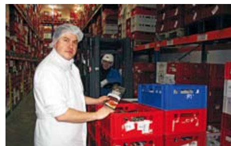
15.00 A jsme na konci cesty, z expedice už výrobky míří do obchodů.