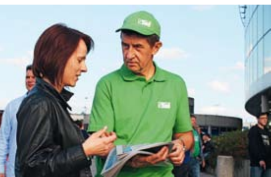
Vydavatel týdeníku 5plus2 Andrej Babiš si vyzkoušel práci kamelota.

Český miliardář, vlastník skupiny Agrofert, vydavatel 5plus2... A v neposlední řadě také fanoušek skupiny Kabát se vydal mezi návštěvníky jejich pražského koncertu v O 2 areně a poté i za členy skupiny, aby jim osobně představil týdeník v novém. „Nebolí vás už nohy?“ ptám se a sama mu málem nestačím. „Ne, proč?“ směje se a přiznává, že práci kolportéra zatím nezkoušel.