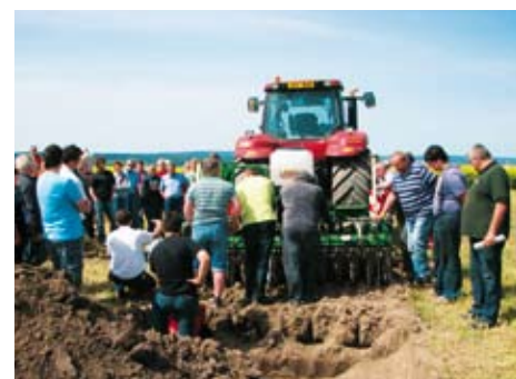
S každým strojem seznámí zájemce odborníci.