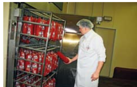
13.00 Po tepelné úpravě jsou výrobky zchlazovány v chladicím tunelu.