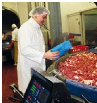
7.30 Při míchání masa se do kutrů přidává koření podle receptury.