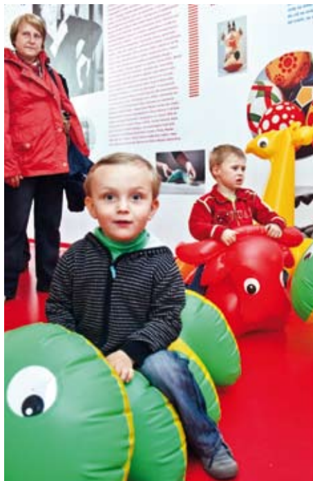
Lety prověřené hračky umí pobavit děti i dnes.

„Dospělí i děti si zde mohou s nafukovacími hračkami hrát na ploše zabírající velkou část sálu. Navíc se návštěvník interaktivní cestou dozví o historii výroby hraček ve Fatře,“ prozradil výtvarník, který je synem Libuše Niklové. „Právě moje maminka je prvním, kdo se mi vybaví při pohledu na tuto výstavu,“ doplnil. Expozice se věnuje archivním hračkám a dokumentačním materiálům nainstalovaným hravou formou,