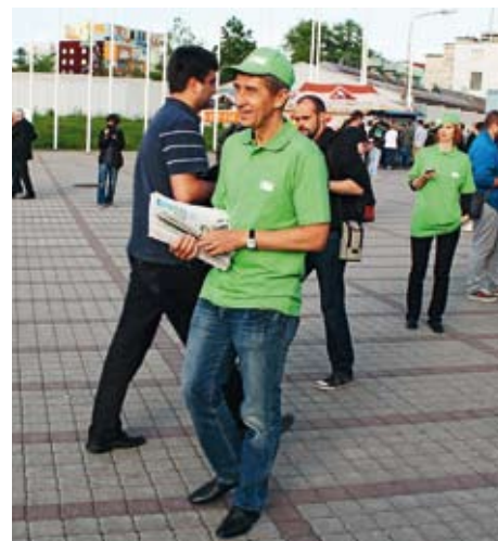
„Pěěě plus dvááá, primátor vyhání kmotry!“ Kamelot v zeleném tričku a kšiltovce prochází mezi návštěvníky koncertu skupiny Kabát a vyvolává obsah vydání.

„Primátor vyhání kmotry!“ vyvolává kamelot v zeleném triku a kšiltovce a prochází mezi návštěvníky koncertu skupiny Kabát. Rozdává týdeník 5plus2. Tmavovláska vzhledne. „Můžu se s vámi vyfotit?“ Kamelot souhlasí. Ten, s nímž se právě zvěčnila, je Andrej Babiš.