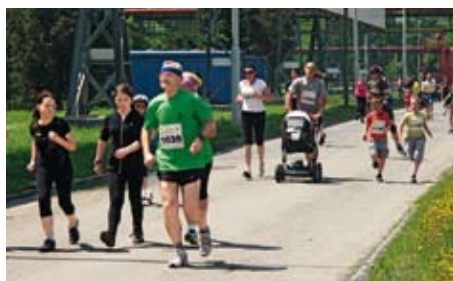
Do rodinného běhu se zapojily i mladé rodiny s kočárky.

Běžecké závody se těšily velkému zájmu. Děti soutěžily na tratích 300, 600 a 900 metrů podle věkových kategorií. Celkem se těchto běhů zúčastnilo 248 nadšených dětí. Rodinný běh byl koncipován jako happeningový běh rodinných