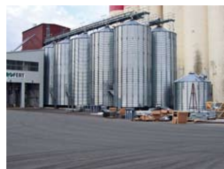
Modernizovaný areál společnosti Agrofert Deutschland v Bischofswerdē.

roku a k jeho hlavním činnostem bude patřit zpracování, skladování a prodej tekutých hnojiv vyráběných v koncernu Agrofert.