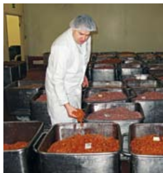
9.00 Vše je připraveno k převozu na narážení. Každý vozík má své číslo a přísná evidence provází celý proces.