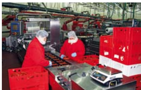
14.30 Závěrečná fáze - balení. A příležitost výrobky opět zkontrolovat.