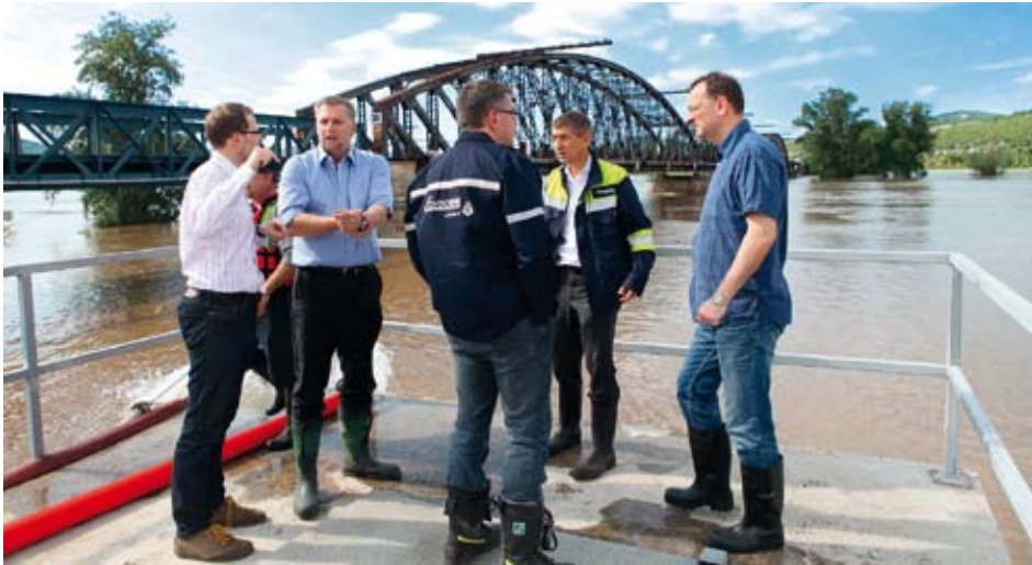
Areál továrny ohrožený velkou vodou přijeli obhlédnout bývalý premiér Petr Nečas a ministr zemědělství Petr Bendl.