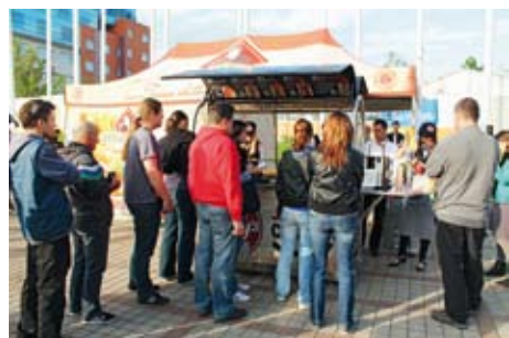
Hotdogy s povítkovými párky, které nesou název Parky's, návštěvníkům koncertu chutnaly.

„Chcete párek?“ ptá se skupinky mladíků jejich vrstevník. Míří do fronty u stánku Kosteckých uzenin. Jaký si asi dá? Javořícký, Debrecinský, Čertíka...? Hodina do začátku koncertu a párky jdou na dračku. Největší zájem je prý o klasiku