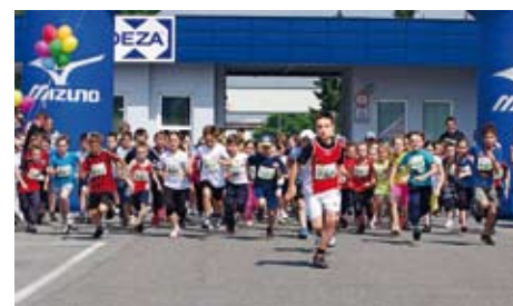
Děti soutěžily na tratích 300, 600 a 900 metrů podle věkových kategorií.