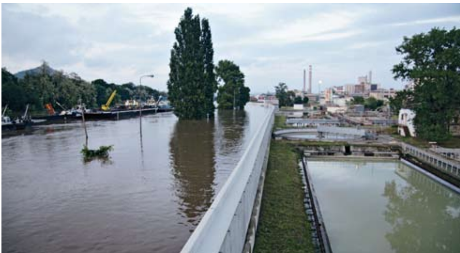
Protipovodňová stěna odolala mohutnému náporu vody.