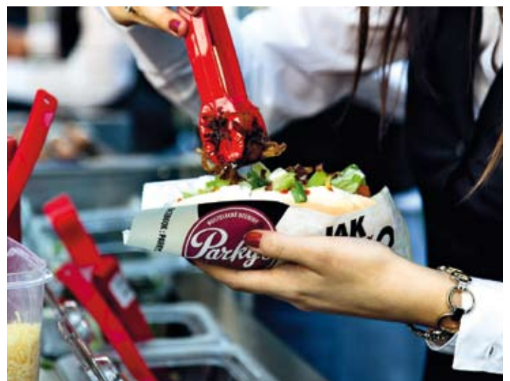
Parky's - kvalitní ingredience, atraktivní design, moderní technologie.