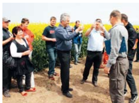
Nová odrůda řepky je vždy důvodem k přípitku.

Polní den, nad nímž převzala záštitu společnost Preol, se tradičně zaměřil na pěstování řepky ozimé, určené k výrobě řepkového oleje.