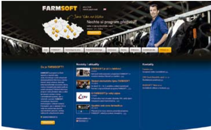
FARMSOFT - více řídit, méně papírovat

Informace o jednotlivých zvířatech a celém chovu musí mít vždycky aktuální a k dispozici. Jejich zpracování mu umožní sledovat, co se ve stádě zrovna děje a rychle vyhodnotit, co je potřeba právě nyní udělat. Společnost FARMTEC a. s. se proto rozhodla vyvinout zootechnický program FARMSOFT, který již od loňského podzimu nabízí všem chovatelům skotu. Zkušenosti z prvních několika desítek instalací ukazují, že jakmile se zootechnik „ponoří“ do programu a začne údaje o zvířatech používat, vyhodnocovat, třídit a zadávat další informace, zjistí, že má v ruce poměrně jednoduchý nástroj na opravdové ucelené řízení svého stáda i třeba celého podniku.