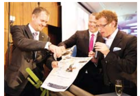
Křtilo se jak jinak než šampaňským.