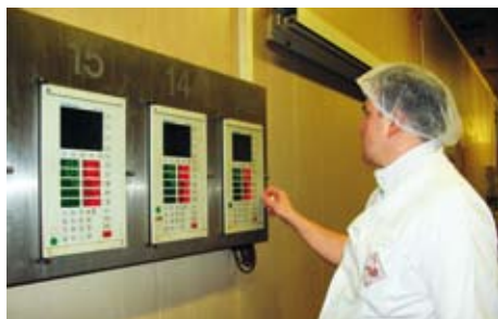
12.00 Následuje tepelná úprava. Párky, salámy i další speciality projdou komorami, v nichž se vaří a udí.