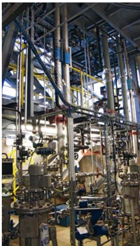
Ide o unikátne dielo (objemy zariadení v desiatkach, až stovkách litrov, teplota v prietokových reaktoroch vyššia ako 200 °C, maximálny tlak 5 MPa), ktoré v rámci Slovenska, ani v blízkom okolí nemá svoju analógiu.

V roku 2013 bolo sústredenie riešiteľských kapacít najmä na Aktivitu 1.1: Vybudovanie a výskumné využitie experimentálnej hydrogenačnej jednotky. S ňou súvisia Aktivity 2.1: Príprava a charakterizovanie nosičových katalyzátorov vhodných na hydrogenáciu v kvapalnej fáze a Aktivita 3.1: Výskum hydrogenácie aromatických dusíkatých zlúčenín s dôrazom na prenos výsledkov z laboratórneho do priemyselného meradla.