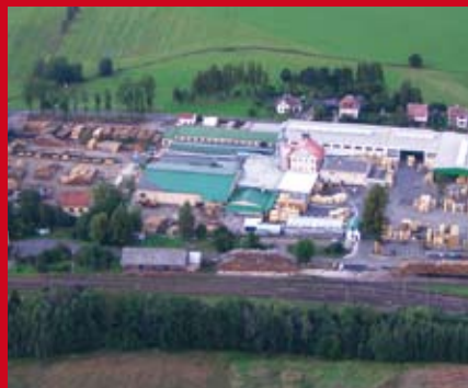
Letecký pohled na společnost JILOS HORKA, s. r. o.

Společnost JILOS HORKA, s. r. o., je od února 2013 součástí AGROFERT HOLDINGU. Jedná se o moderní dřevozpracující firmu se sídlem v podhůří Krkonoš, v obci Horka u Staré Paky. Společnost zaměstnává přibližně 220 lidí a sídlí v areálu o rozloze 5 ha. V dvou-směnném nepřetržitém provozu vyprodukuje měsíčně cca 220 000 ks hotových výrobků (palety, paletové ohrádky, paletové přířezy a hranolky). Druhým rokem firma provádí opravy a prodej použitých palet EUR a v roce 2010 získala licenci EPAL. V roce 2012 činil obrát společnosti cca 481,3 mil. Kč (18,7 mil. EUR).