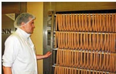
12.15 Tepelné opracování je pro každý produkt jiné. Správnou teplotu a čas hlídá moderní technika.