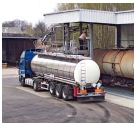
Cisternová zařízení používaná k vykládce a nakládce tekutých hnojiv.

Společnost AGRO Service NORD má od 21. března nového vlastníka. Kupujícím je Agrofert Deutschland. Notářská kupní smlou-